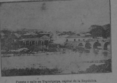
Puente y calle en Tegucigalpa, capital de la República.